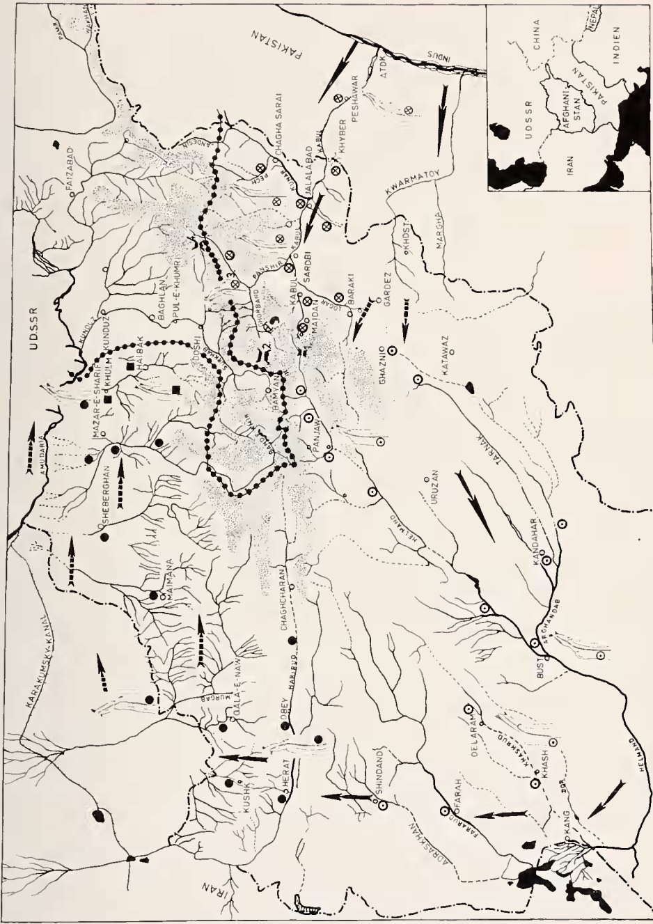
Abb. 1. Verbreitung und Einwanderung von Potamon gedrosianum in Afghanistan. \otimes Indus-System, \odot Helmand-System, \bullet Amu Dario-System, \blacksquare Khulm-Fluß. Die wichtigsten Pässe sind mit Ziffern gekennzeichnet: 1. Unai-Paß, 2. Shibar-Paß, 3. Salang-Paß, 4. Anjuman-Paß. \cdots : Gebiete, in denen keine Krabben gefunden wurden. Die Zentralgebirge (Hindukush und Koh-e-Baba) sind punktiert angedeutet (über 3000 m Höhe). Die Pfeile geben den Einwanderungsweg aus dem Indus an; durchbrochene Pfeile symbolisieren den vermutlichen Wanderweg. In den verschiedenen Flußsystemen sind die typischen Gonopodenformen der Männchen eingezeichnet (vgl. Abb. 2).